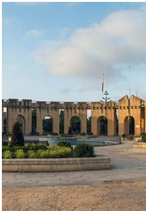
L'entrata del parco di Ta' Qali.

Una domanda comune fra gli italiani che vivono sull'arcipelago maltese, è: «Ci sono dei parchi a Malta?» La risposta è sì, e sono spesso puliti e ben organizzati. Sparsi per tutta l'isola hanno in comune